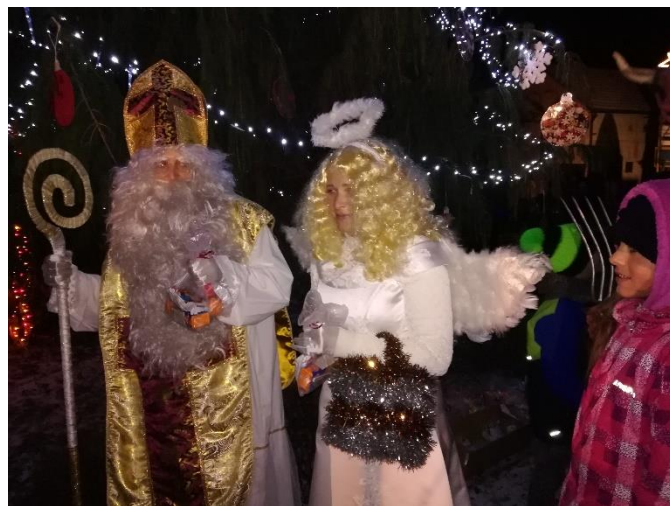
Malá vzpomínka na předvánoční čas v roce 2018...