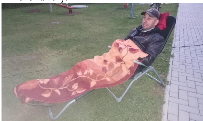
Pohodu u letního kina si užíval i pan starosta 😊

Letošní koupací sezóna byla oproti loňsku výrazně úspěšnější. Celkem navštívilo naše koupaliště více jak 9000 návštěvníků a hospodaření skončilo s více jak stopadesátitisícovým plusem. Novinkou letošního roku bylo pořízení kina, které se provozovalo každých 14 dní a našlo si celou řadu návštěvníků. Určitě v této aktivitě budeme pokračovat a nabídneme zájemcům jak příjemné posezení v přírodním prostředí, tak kvalitní filmové zážitky.