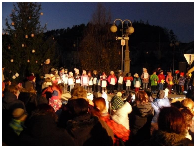
...a v roce 2017.

Krásné, pohodové sváteční dny a hodně sil a zdraví všem! A vše nejlepší v novém roce 2021.