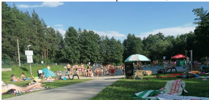
Letošní sezona se vydařila.