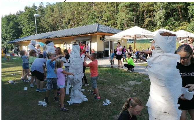
Areál koupaliště je příjemným prostředím pro různé akce.